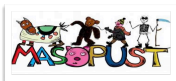
KALENDÁŘ AKCÍ STRANA 3