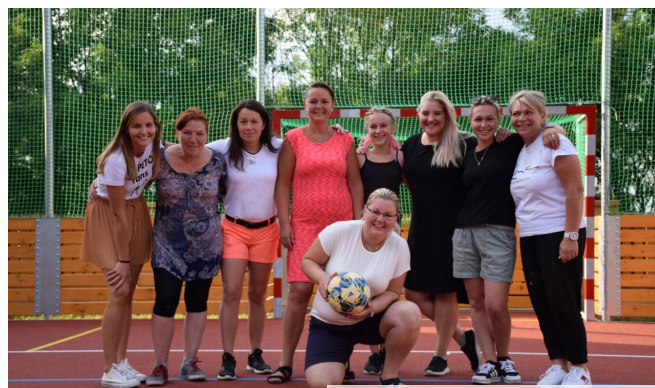
OTEVŘENÍ SPORTOVNÍHO HŘIŠTĚ