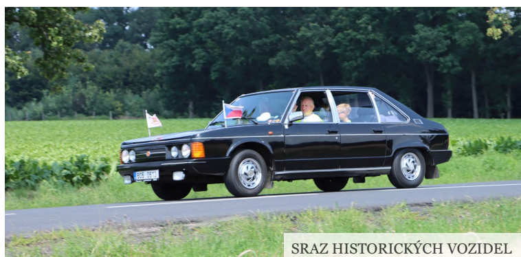
SRAZ HISTORICKÝCH VOZIDEL