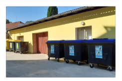
ODPADY STRANA 4