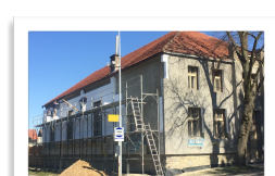
SOKOLOVNA STRANA 5-7