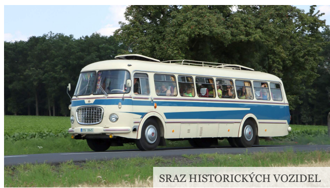
SRAZ HISTORICKÝCH VOZIDEL